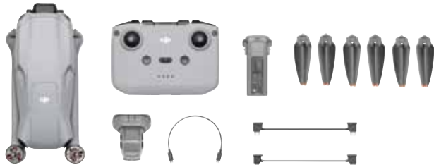
機体 / 送信機 (RC-N2) ※1 / バッテリー / プロペラ (3組) / ジンバル プロテクター / Type-C - Type-C ケーブル / USB-C コネクター / Lightning コネクター