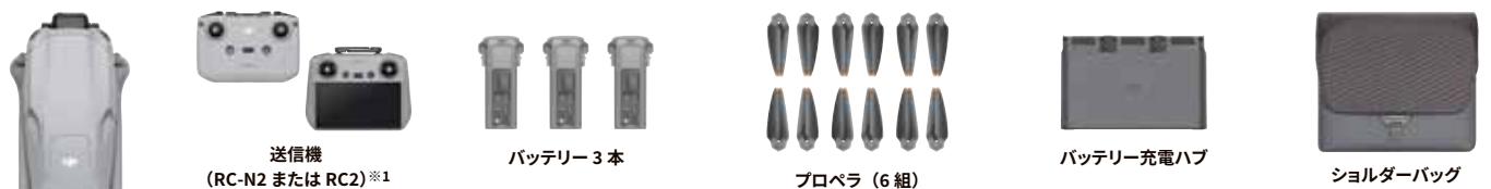
送信機 (RC-N2 または RC2) ※1