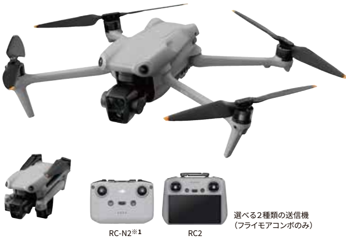
選べる2種類の送信機 (フライモアコンボのみ)

Air シリーズで初めて 2つのカメラを搭載。 性能と価格の バランスが優れたモデル。